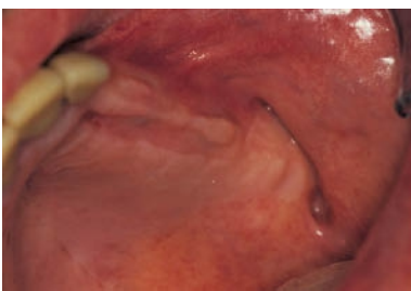
Abb. 3: Reizlose Abheilung mit deutlicher Reduktion der Schmerzsymptomatik nach einmaliger Anwendung.