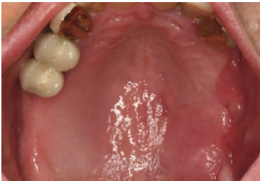
Abb. 6: Reizlose Abheilung mit sekundärer Granulation der Weichgewebssdefektes im Oberkiefer.