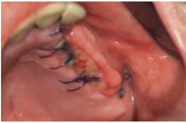
Abb. 1: Wundheilungsstörung nach Sinusbodenelevation bei palatinal versetzter Schnittführung.