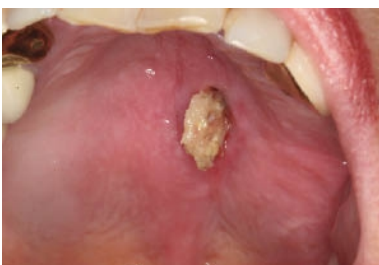
Abb. 4: Wiederholte Sequesterbildung bei bereits erfolgter plastischer Deckung nach bisphosphonatinduzierter Nekrose nach Extraktion 26.