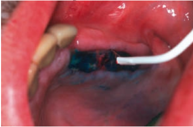
Abb. 2: Oberflächige Bestrahlung mit 2D-Sonde nach Nahtentfernung und Reduktion des Photosensitizers durch Spülen.